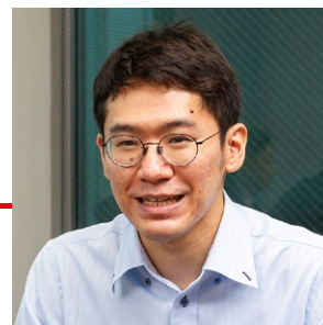
SBI R3 Japan株式会社 ビジネス開発部