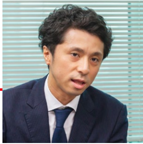
SBIリクイディティ・マーケット株式会社 業務ソリューション部長

そこで、SBIリクイディティ・マーケットは、Cordaを活用して、コンファメーション業務を統合的に行うための「BCPostTrade」というシステムを開発した。