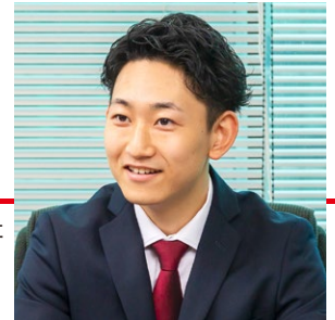
SBIリクイディティ・マーケット株式会社 業務ソリューション部

一方、Cordaを提供するSBI R3 Japanも、前述したように金融機関や製造業、流通・小売業など、あらゆる企業にCordaの活用を積極的に提案していく構えだ。「例えば、国や地域によっては法規制などによってデータを国外に持ち出すことができない場合があります。双方がノードを保有し、データを国内で保存で